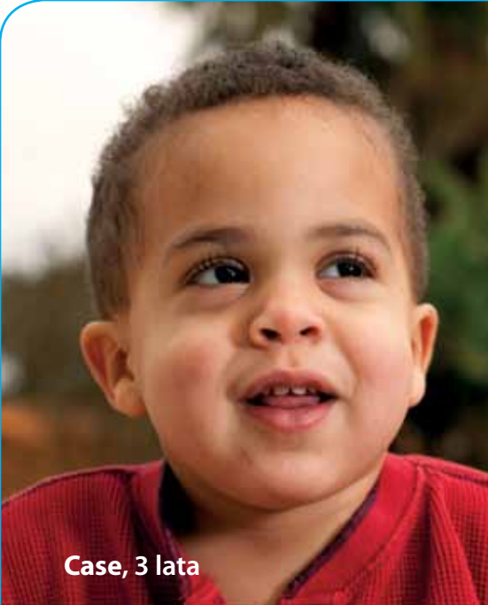
Case, 3 lata