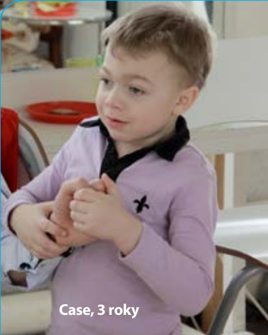
Case, 3 roky